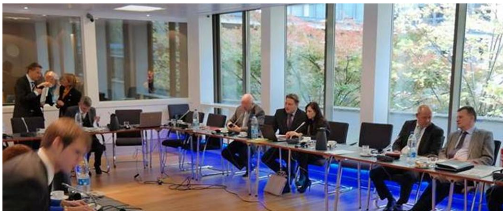
Zasadnutie členov UNIEP- u v Bruseli.