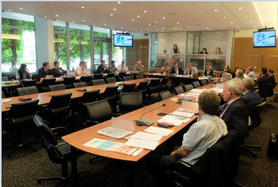
Počas Valného zhromaždenia v Paríži.