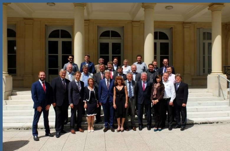
Členovia, ktorí sa zúčastnili Valného zhromaždenia v Paríži.